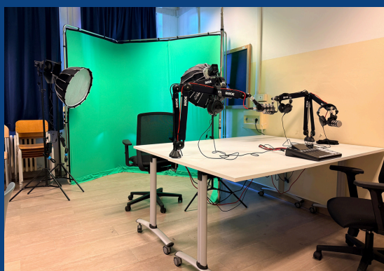
Web Radio e Web TV