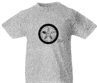
Fondi strutturali Europei.jpg 68K